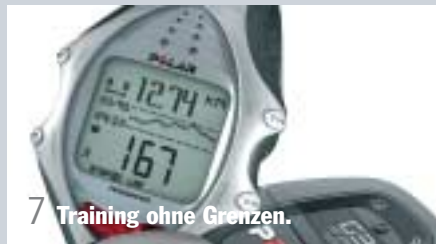
7 Training ohne Grenzen.