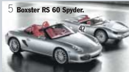
5 Boxster RS 60 Spyder.