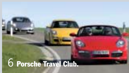
6 Porsche Travel Club.