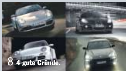
8 4 gute Gründe.