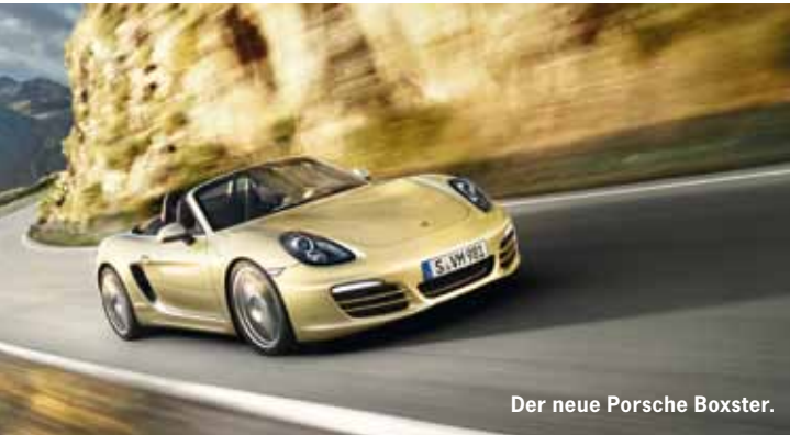
Der neue Porsche Boxster.