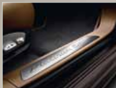
Einstiegsleisten mit Schriftzug „Platinum Edition“.