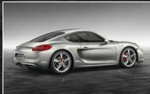
Exterieur-Paket lackiert** und 20-Zoll SportTechno Rad*