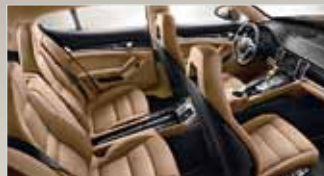
Zweifarbige Teillederausstattung in Schwarz und Luxorbeige.