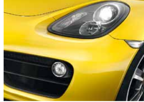
Runde Bugleuchte mit Tagfahr- und Positionslicht.