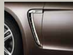
Seitliche Luftauslässe in Platinsilber.