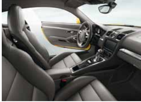
Sportlich und komfortabel: das Innenraumkonzept.