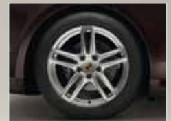
19-Zoll Panamera Turbo Räder mit farbigem Porsche Wappen.

Kraftstoffverbrauch/ Emissionen Porsche Panamera Platinum Modelle (in l/100 km): außerorts 7,8 – 5,6 · innerorts 16,4 – 8,1 · kombiniert 11,3 – 6,3 · CO 2 - Emission in g/km 265/167 · Effizienzklasse C – G