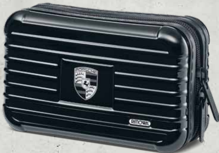
Schwarz WAP 035 302 OD | EUR 75,00*