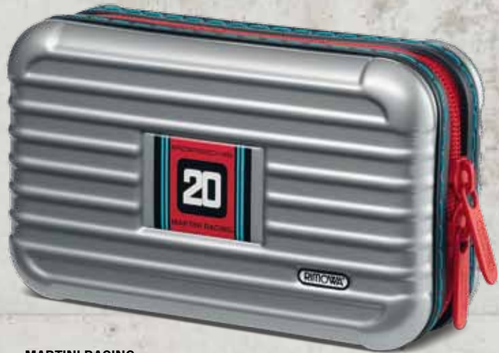
MARTINI RACING WAP 035 303 OD | EUR 85,00*

Und wie es sich für ein Produkt aus dem Hause Porsche gehört, glänzen die PTS Multipurpose Cases nicht nur mit Alltagstauglichkeit, sondern sind auch noch echte Hingucker.