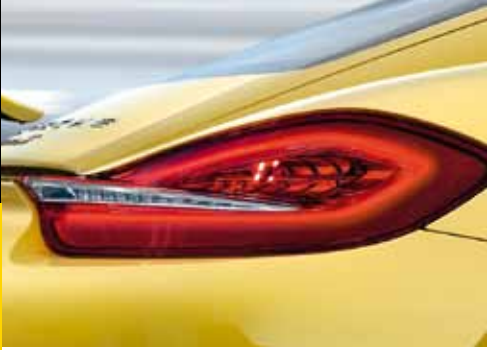
Ausdrucksvolle Heckleuchten in LED-Technik.