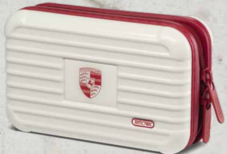
Weiß-Rot WAP 035 301 OD | EUR 75,00*