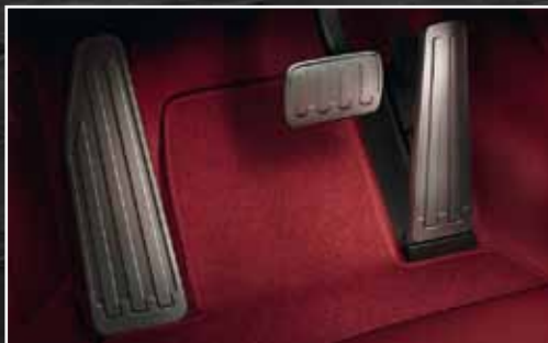
Pedalerie und Fußstütze aus Aluminium*