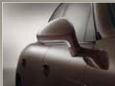
Außenspiegelunterschalen in Platinsilber.

Im Innenraum sorgt die zweifarbige Teillederausstattung in Schwarz und Luxorbeige sowie die Sitzheizung vorne für Komfort. Das SportDesign Lenkrad ist in Verbindung mit PDK oder Tiptronic ein weiteres serienmäßiges Highlight. Und den richtigen Weg schlagen Sie dank des Porsche Communication Managements inkl. Navigationsmodul ein. Am Ziel angekommen ist auf den ebenfalls serienmäßigen ParkAssistenten Verlass. Welches Ziel Sie auch immer ansteuern: Den richtigen Weg haben Sie bereits gewählt. Den Porsche Weg. Er hält noch weitere Individualisierungsmöglichkeiten für Sie bereit. Und lässt dabei keine Wünsche offen. Erleben Sie den Feinschliff – mit der Porsche Panamera Platinum Edition.