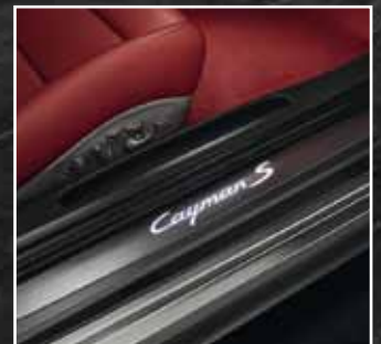
Türeinstiegsblende aus Edelstahl, beleuchtet*