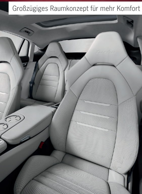
Großzügiges Raumkonzept für mehr Komfort