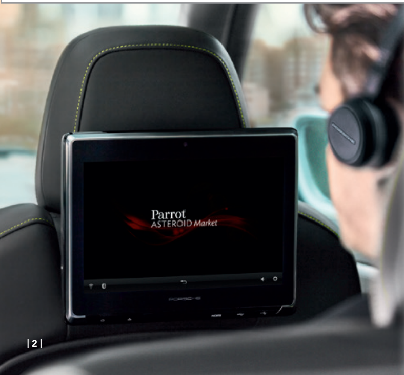
| 2 |