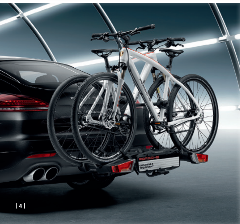
| 4 |