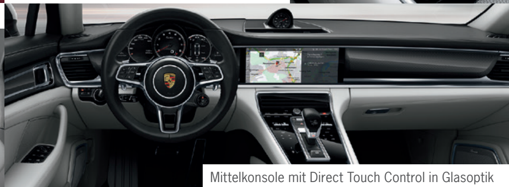
Mittelkonsole mit Direct Touch Control in Glasoptik