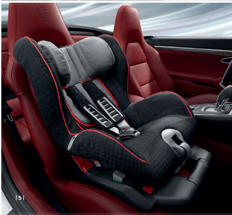
| 5 |