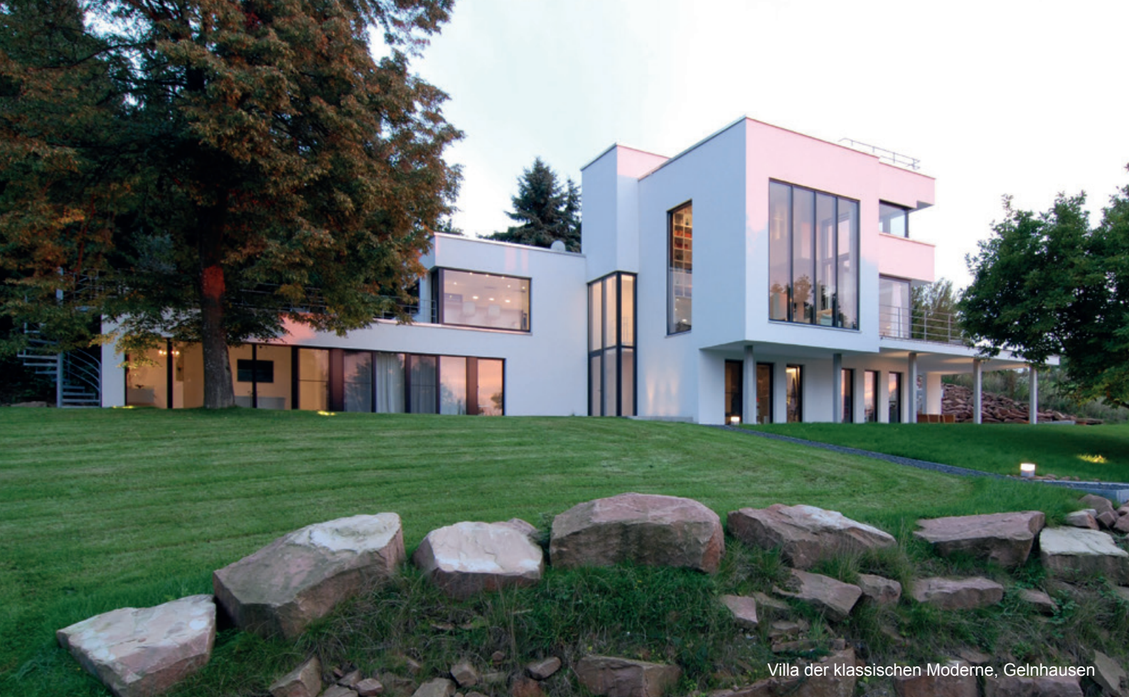
Villa der klassischen Moderne, Gelnhausen