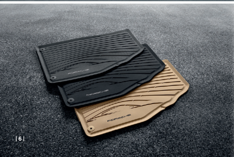
| 6 |