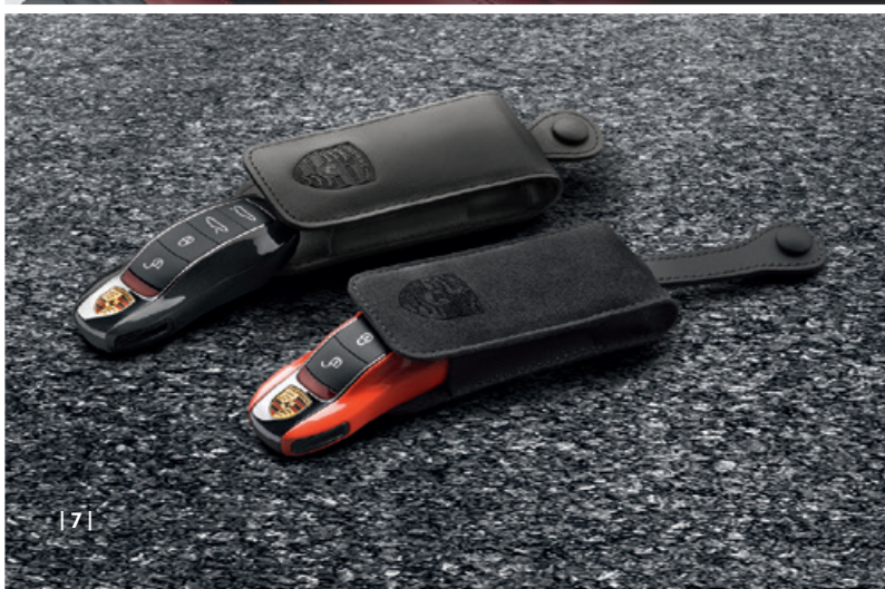
| 7 |

Porsche Macan S - Kraftstoffverbrauch (in l/100 km): innerorts 11,6–11,3 · außerorts 7,6–7,3 · kombiniert 9,0–8,7; CO 2 -Emissionen: 212–204 g/km