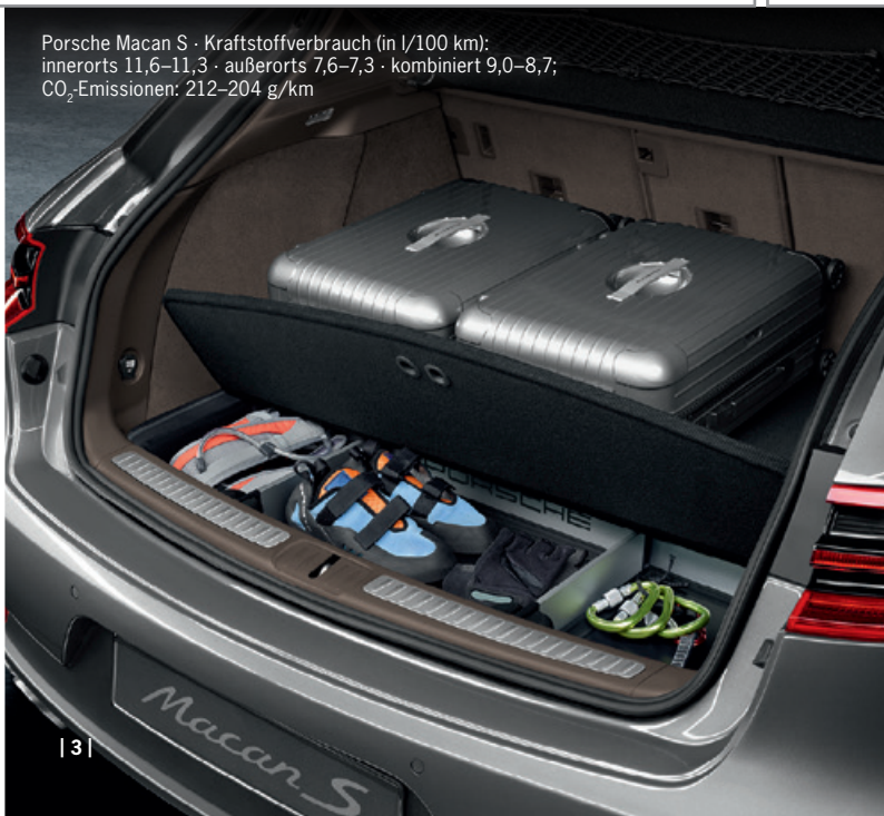
| 3 |